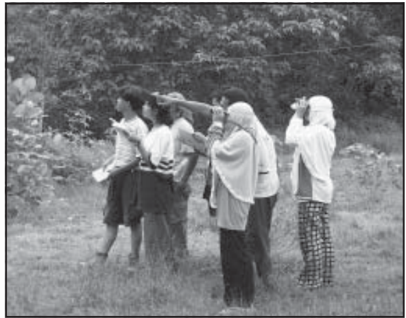
Participants à un camp de familiarisation avec la nature

compagnie d'environ 3 000 enfants et adultes. Depuis, Kak Seto et le projet IFFM ont produit ensemble un clip vidéo "Si Pongi" pour la télévision nationale, dont