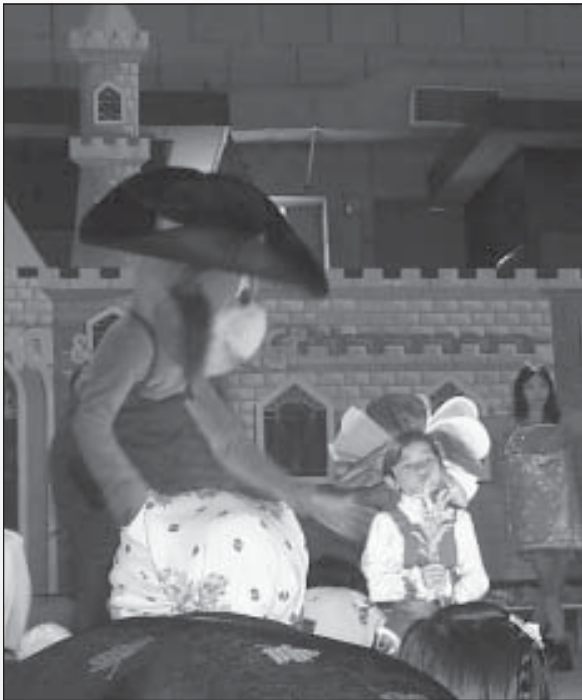
Show "Si Pongi"

Pour assurer la promotion de la mascotte indonésienne de la prévention des incendies, appelée "Si Pongi", divers supports de vulgarisation ont été produits et plusieurs manifestations ont été organisées. Depuis plus d'un an, la star de télévision indonésienne Kak Seto et sa Mutiara Indonesia Foundation coopèrent avec le projet IFFM et contribuent à sensibiliser davantage les enfants aux forêts et aux feux de forêt. En avril 1999, Kak Seto a présenté "Si Pongi" lors d'un grand spectacle à Samarinda, en