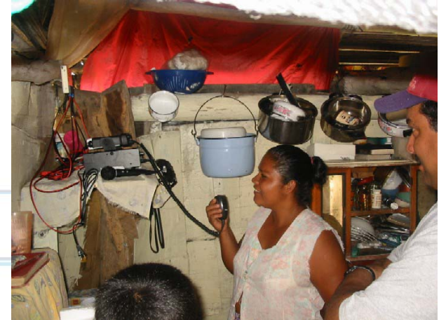
Manejo de SAT por voluntarios