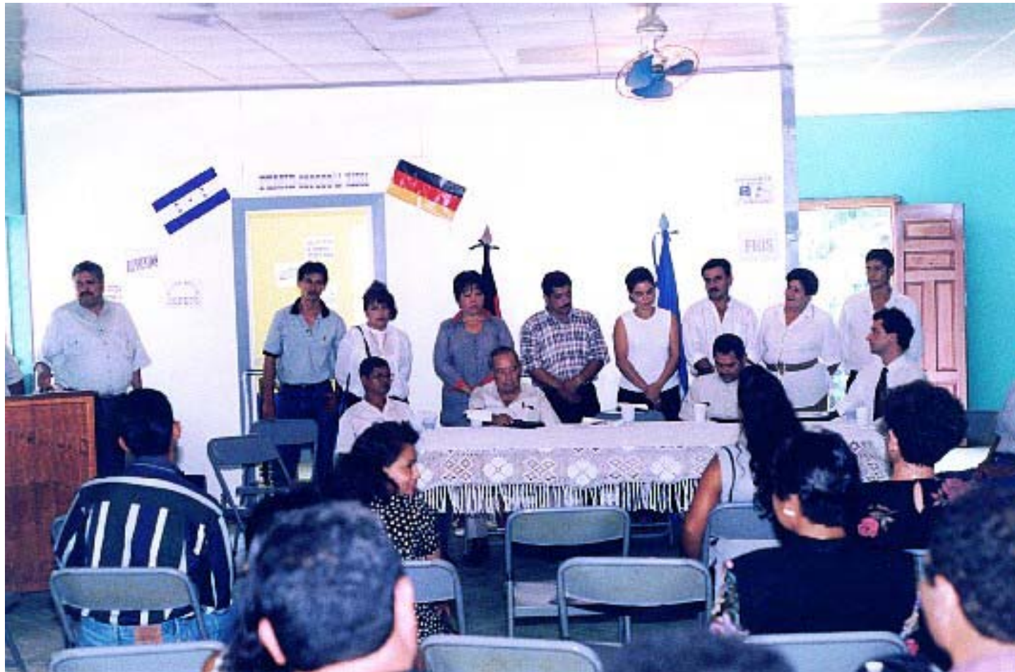
Participación de la Sociedad Civil en la Instalación del Programa Municipal de Sistema de Alerta Temprana (PROMSAT)