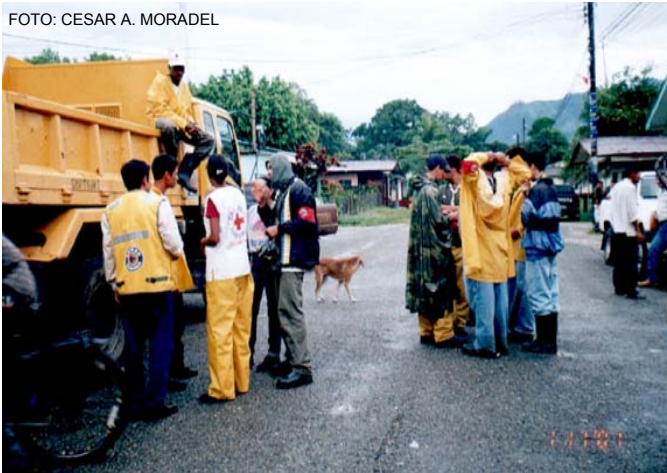
Aumento en la calidad de Respuesta