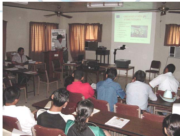
Taller de diagnóstico Participativo