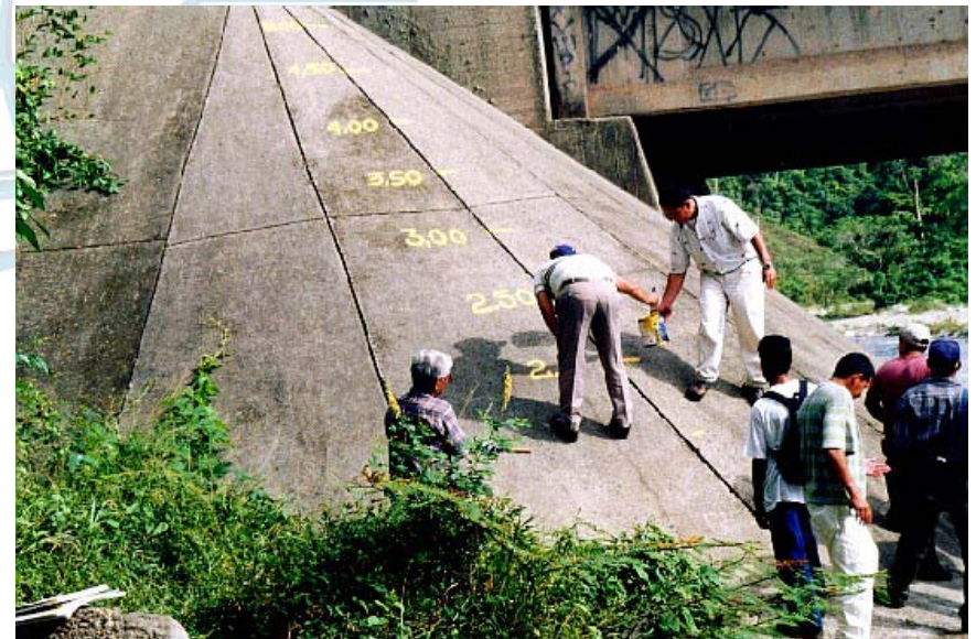
Pintando escala hidrométrica en una base de puente por miembros de la comunidad