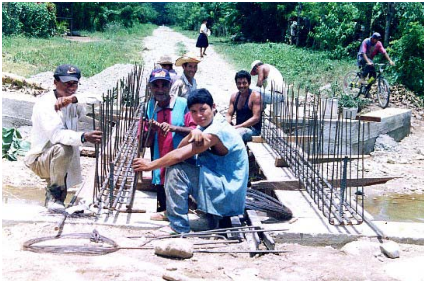
Reconstrucción de caja puente Aldea de Tarritos, La Masica, Atlántida. Proyecto REHLAM – GTZ