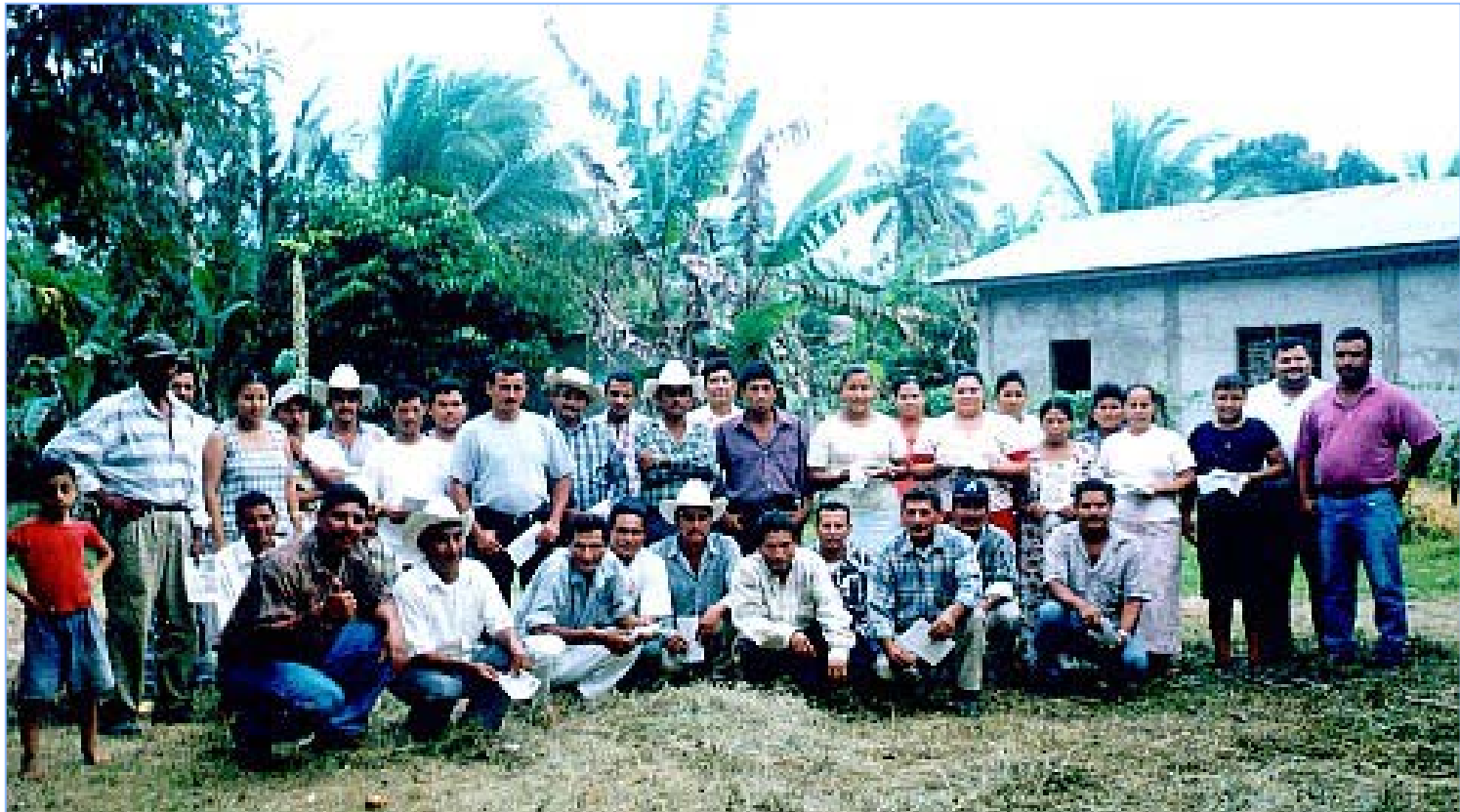
Participantes al Taller de Capacitación sobre SAT en la Aldea Piloto Trípoli, La Masica, Atlántida. (Femid II, GTZ)