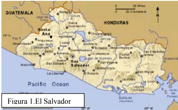
Figura 1. El Salvador

El Salvador está localizado en América Central, entre el norte y sur del Continente Americano. Limita al poniente con Guatemala, al norte con Honduras, al oriente, con Honduras y Nicaragua en el Golfo de Fonseca y al sur con el Océano Pacífico (Figura 1). La extensión territorial de aproximadamente 21,040.79 Kilómetros cuadrados, con 296 Kilómetros de litoral en el Pacífico que se extiende a lo largo del país.